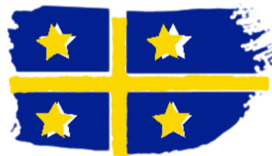
Mairie de Barjac (Gard)