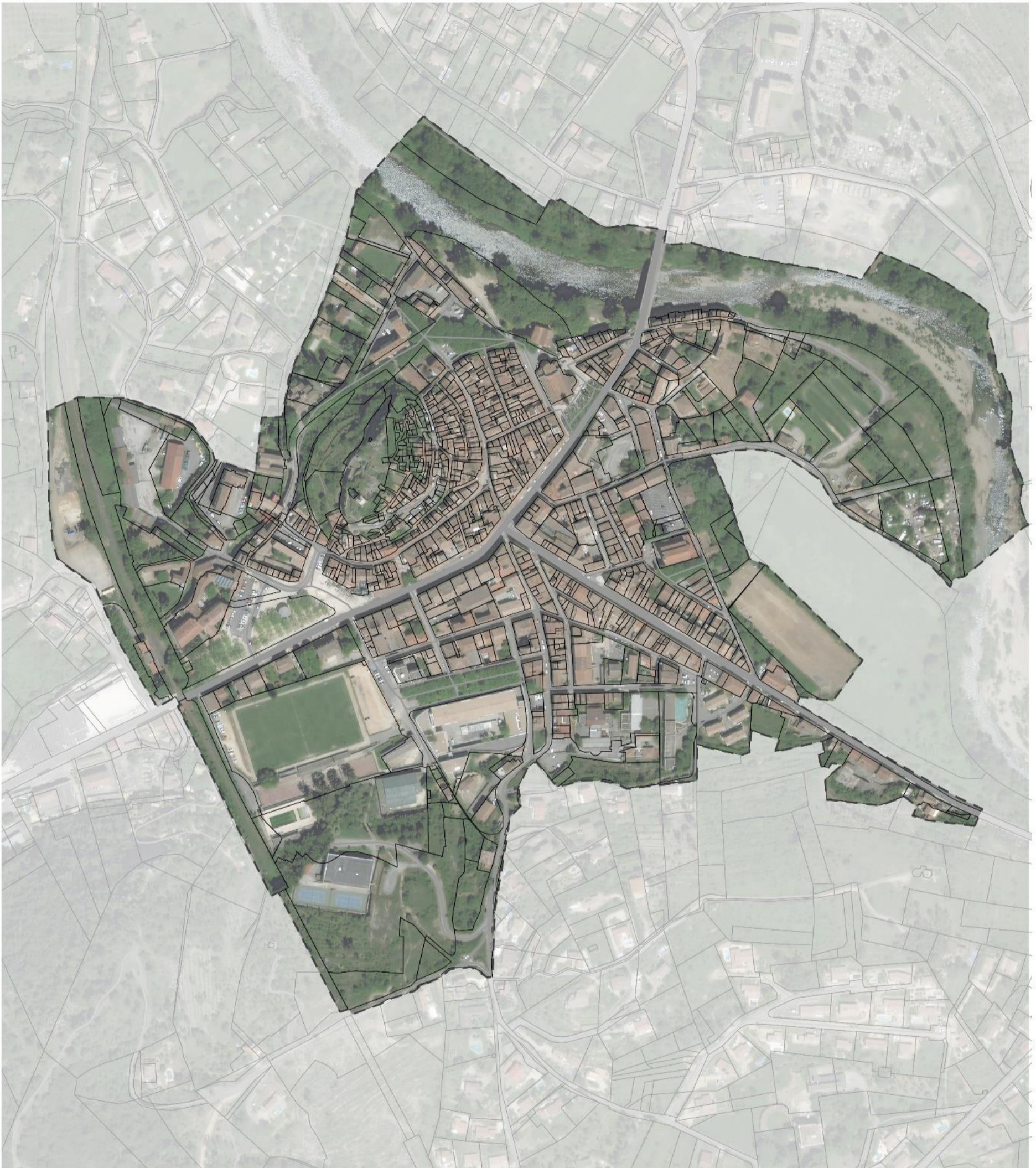
0 75 150 m Date : 09/08/2022